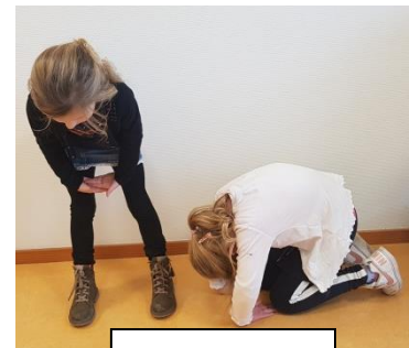
De A en de O

Het was leuk in de bieb, ze willen wel terug. Ze gaan nu meer boeken lezen.