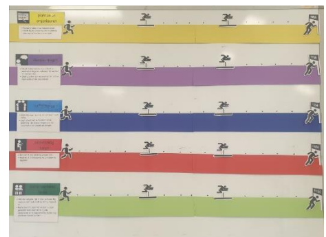
Enkele voorbeelden van doelenborden.