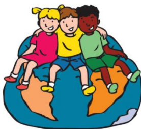
We horen bij elkaar

Het begin van het schooljaar is het moment dat de groep zich vormt. Omdat dat een belangrijk en intensief proces is, starten we elk schooljaar met de gouden weken . Tijdens de gouden weken is er aandacht voor elkaar en samen. Blok 1 van de Vreedzame School is daar helemaal op geschreven.